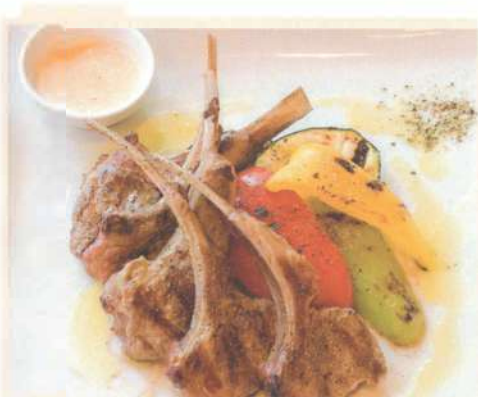
Каре ягнёнка с овощами гриль