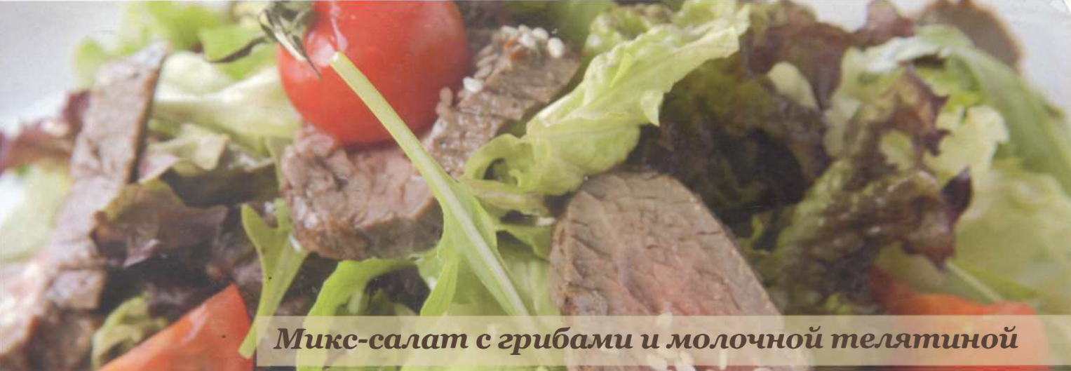
Микс-салат с грибами и молочной телятиной