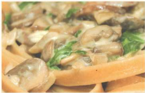
Феттуччини с грибами